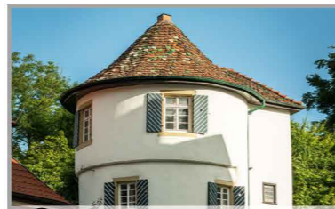
C Grüner Turm

Das Gebäude an der ehemaligen Stadtmauer wurde im 16. Jh. errichtet und diente der Einbringung und Lagerung der Abgaben. Hier befand sich Anfang des 19. Jh. das Laboratorium des Apothekers Bonz, dessen Unternehmen später den reinen Narkoseäther entwickelte.