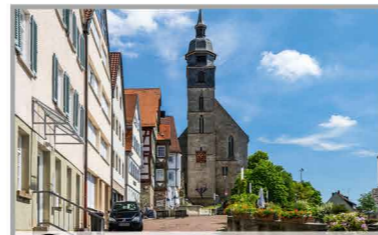
D Ev. Stadtkirche

Der Turm ist einer der erhaltenen Reste der Stadtbefestigung aus dem 16. Jahrhundert. Er wurde bereits im 14. Jahrhundert errichtet und erhielt seinen Namen aufgrund der Farbe seiner Dachziegel. Im 19. Jahrhundert diente er als Gefängnis.